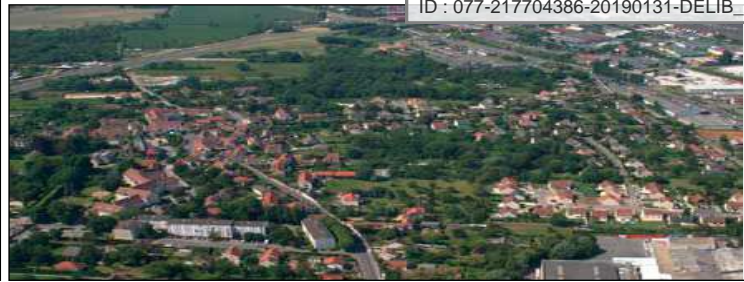
Le quartier de Saint-Germain-des-Noyers (Le nouveau Saint-Thibault-des-Vignes)