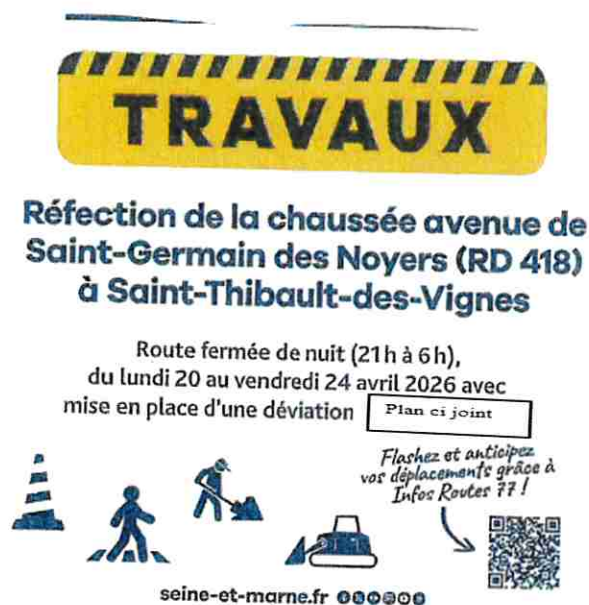
PLAN DE DÉVIATION RD 418 / commune de Saint-Thibault-des-Vignes